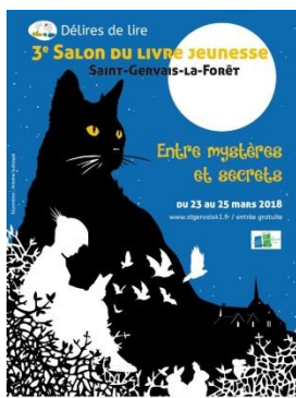
© Salon du livre jeunesse Délires de lire